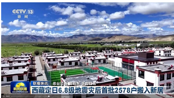
央视《新闻联播》报道西藏定日 6.8 级地震灾后首批 2578 户搬入新居